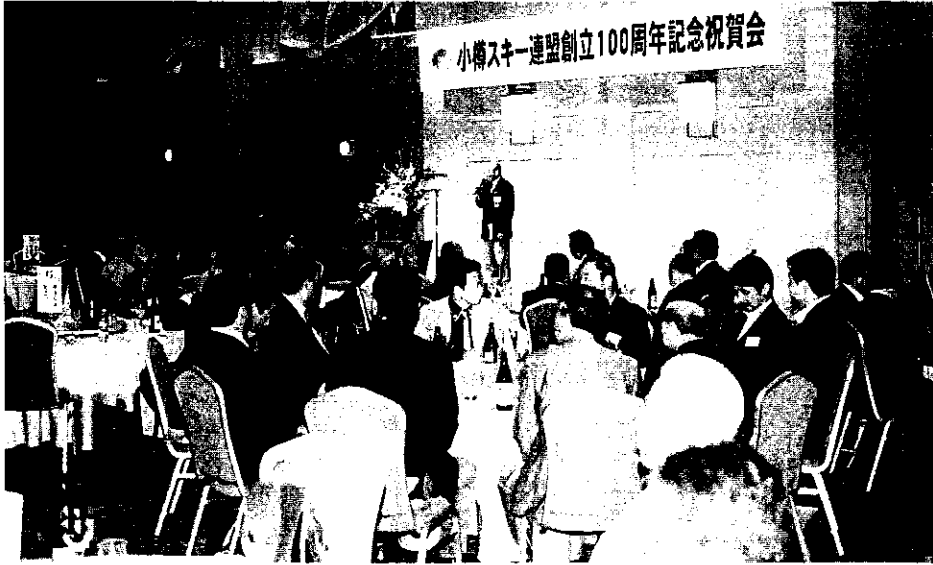
青山実行委員長 (会長) あいさつ