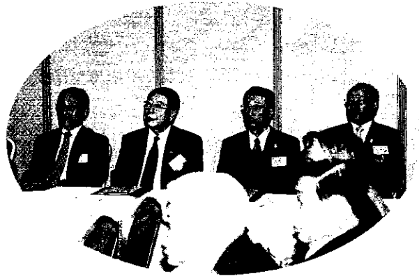
実行委員会役員席