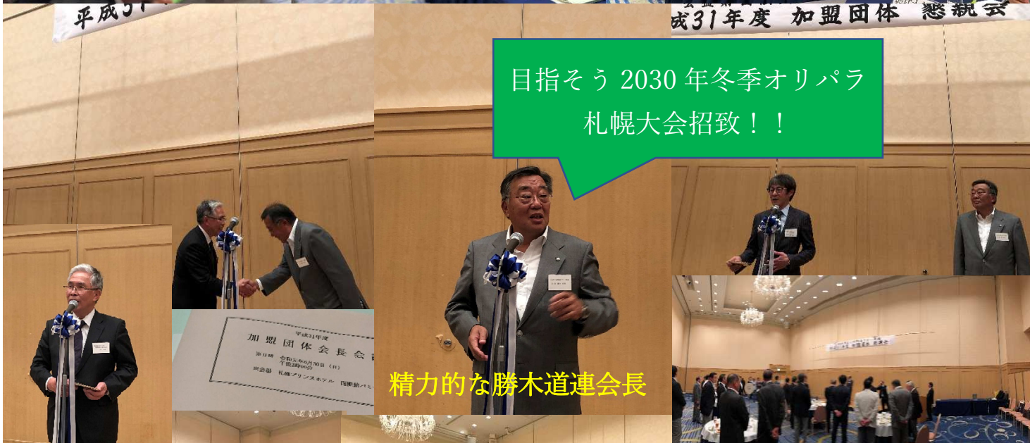
精力的な勝木道連会長